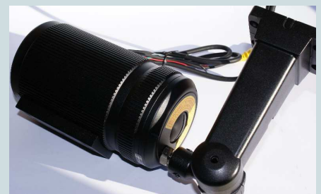
Wandhalter mit verdeckter Kabelführung

Rückseite – Detail: Tipptasten für Einstellungen an der Kamera, im Betrieb mit wasserdichtem Verschluss abgedeckt.