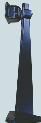
Wandhalter im Lieferumfang

Rückseite: Auto Iris Level Regler, DIP Schalter für AGC, BLC und extra Video Out Cinch Buchse für Einstell-Monitor. (Im Betrieb mit wasserdichtem Verschluss abgedeckt.)